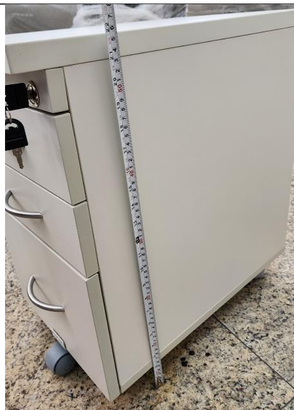
Dimensões: 300(l) x 520(p) x 560(h) mm. Tolerâncias dimensionais: +/- 2%.