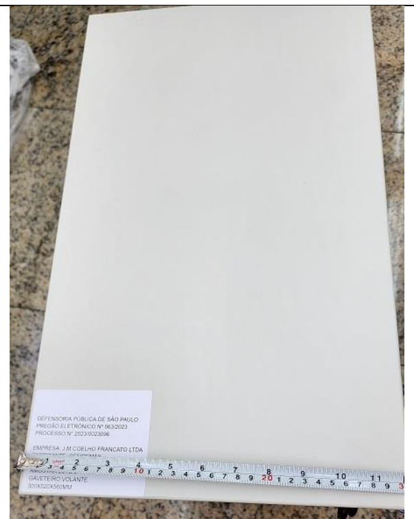
Dimensões: 300(l) x 520(p) x 560(h) mm. Tolerâncias dimensionais: +/- 2%.