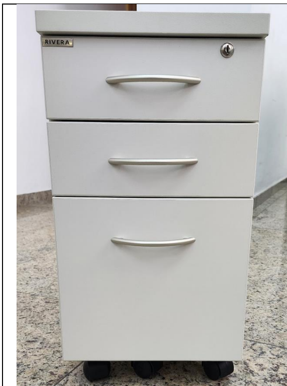
Gaveteiro volante para escritório Cor: Argila Fechadura com segredo único e travamento simultâneo das gavetas.