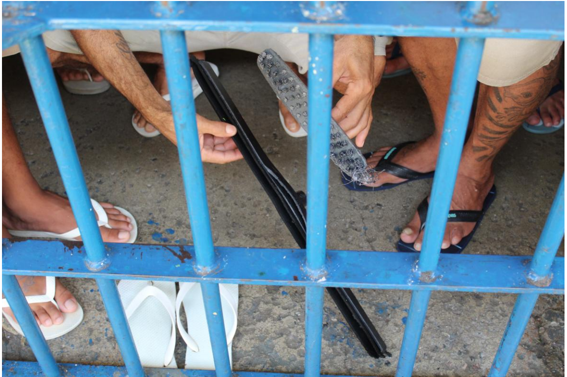
Vassoura e rodo utilizados em uma das celas.

Também relataram demora excessiva na entrega de correspondências (cartas e telegramas).