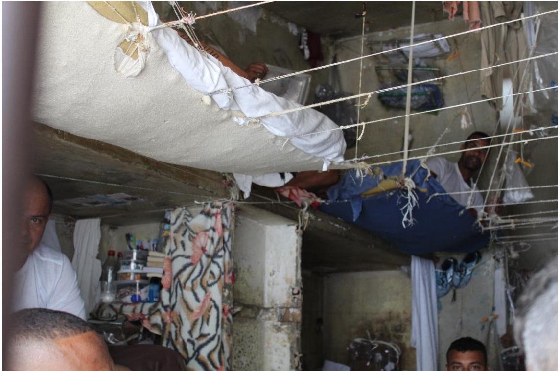
Imagem de uma cela superlotada, onde é possível ver recurso utilizado pelos presos para aumentar o espaço disponível para dormir (colchões pendurados com cordas)

Conforme informações fornecidas pela direção da Unidade, os raios 1, 5 e 7 abrigam, em regra, presos primários. Os raios 3 e 8 os presos faccionados com faltas. Raio 2, presos condenados faccionados. Raio 4 funciona como regime de observação, e o raio 6 está momentaneamente desativado.