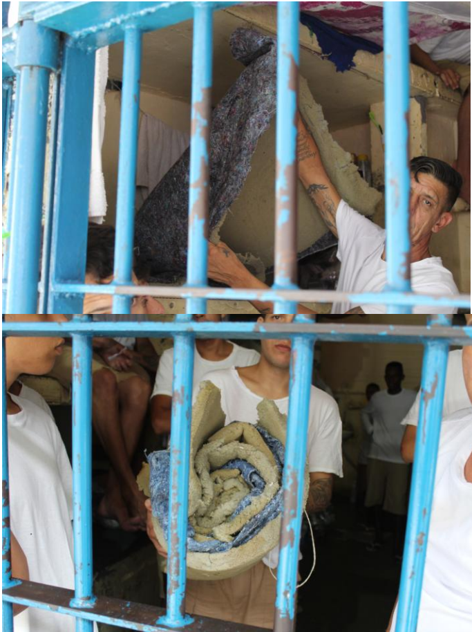
Situação dos colchões utilizados pelos detentos.