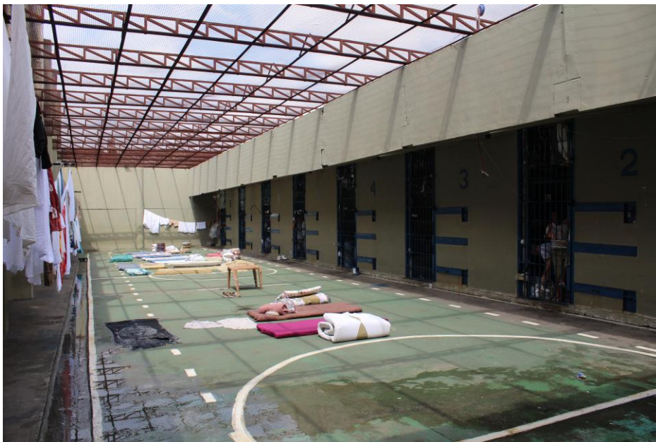
Visão de um dos raios da unidade.