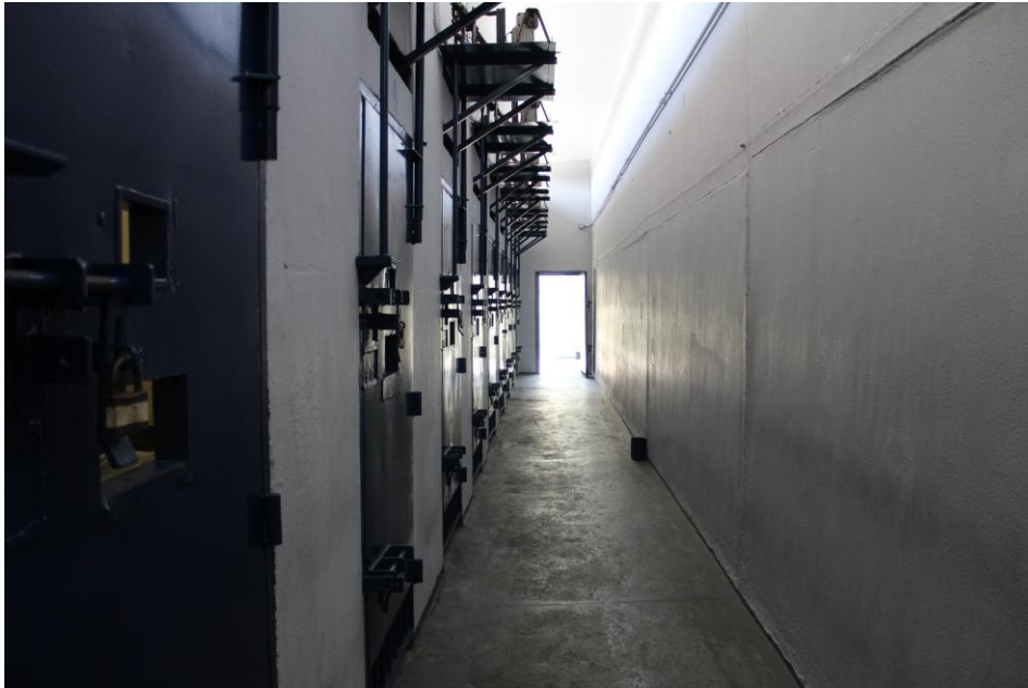
Celas do setor de disciplina.