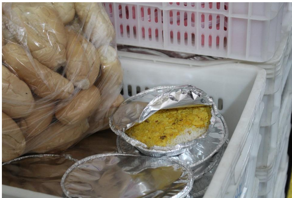
Alimentação servida no dia da inspeção.