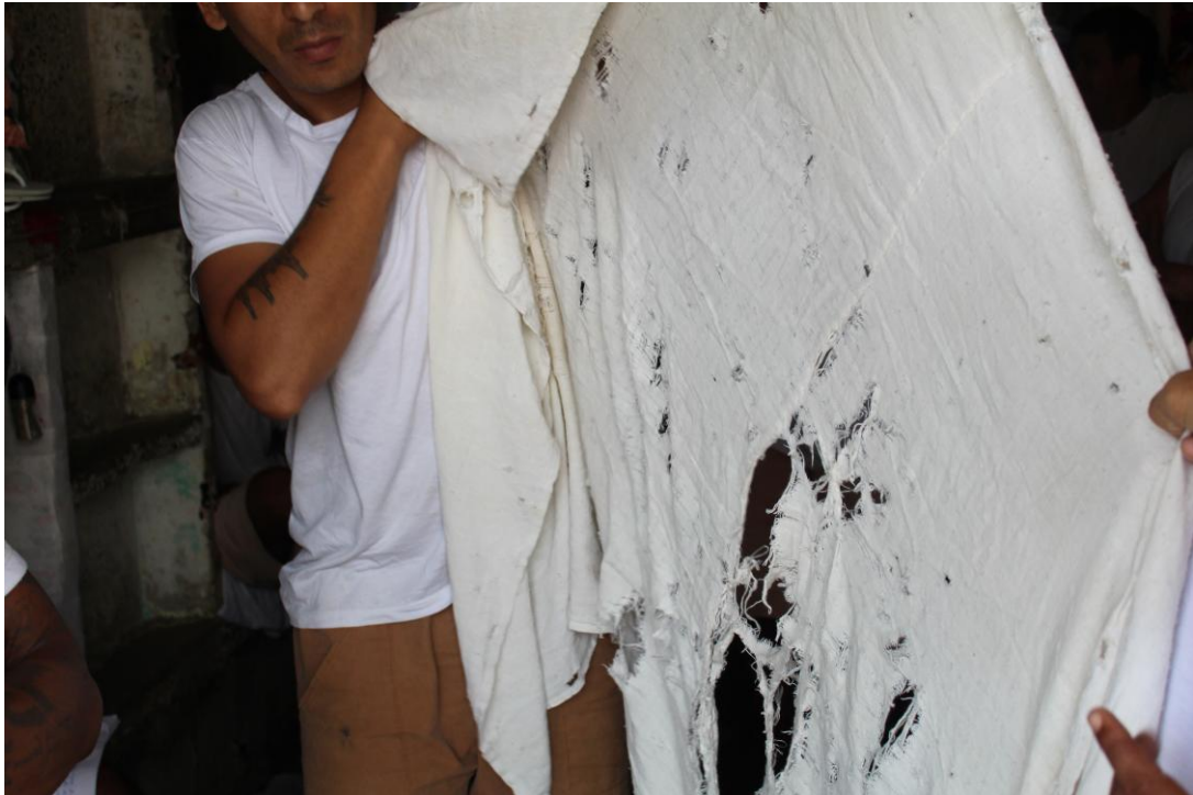
Lençol utilizado pelos detentos.

No setor de seguro, os presos reclamam da ausência de água quente, colchões finos e fornecimento limitado de kits de higiene.