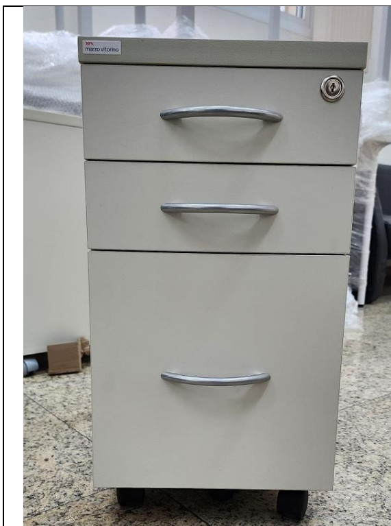
Gaveteiro volante para escritório Cor: Argila