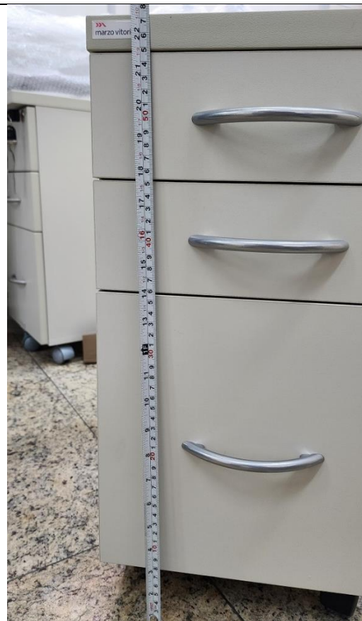
Dimensões: 300(l) x 520(p) x 560(h) mm. Tolerâncias dimensionais: +/- 2%.