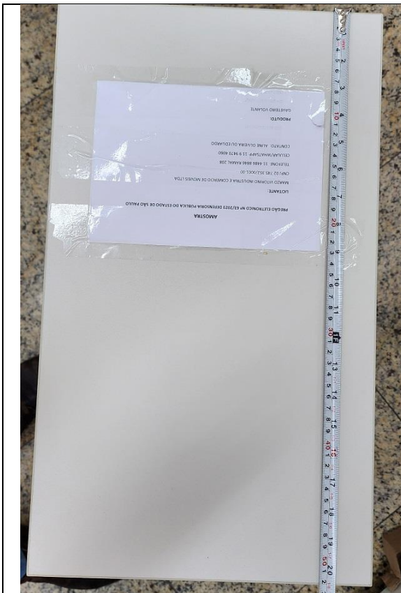
Dimensões: 300(l) x 520(p) x 560(h) mm. Tolerâncias dimensionais: +/- 2%.