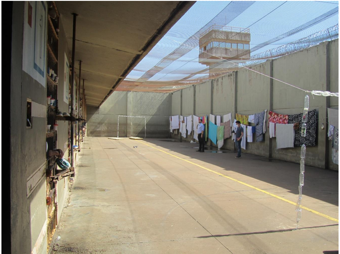
Figura 11. Pátio do raio 7