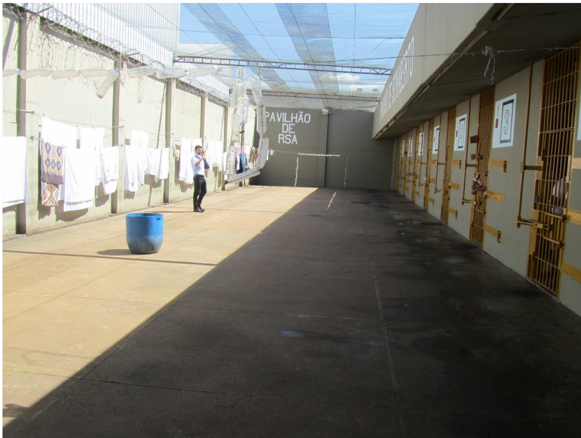
Figura 12. Pátio do raio 1. "Pavilhão do RSA"

Na conversa inicial com a direção da unidade nos foi informado que, desde o dia 04/04/2022, por ordem da Coordenadoria da Região Oeste, os raios 1 e 2 da unidade foram “transformadas em alas de progressão ao regime semiaberto”.