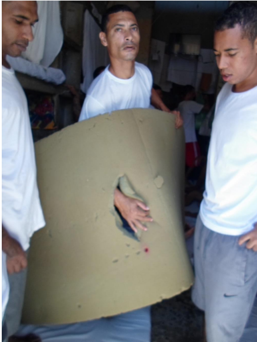
Figura 6. Colchões disponibilizados aos presos