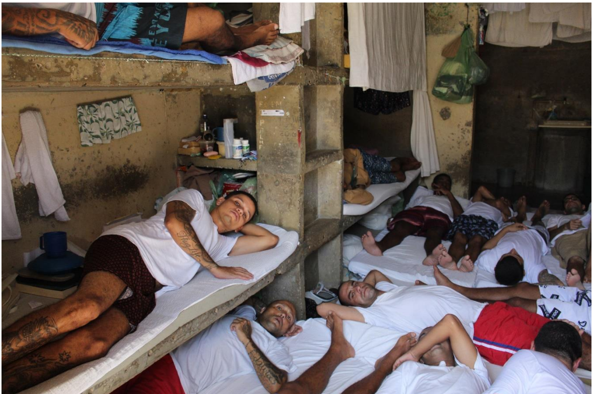
Figura 8. Cella do raio 7