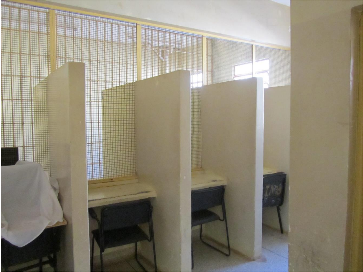
Figura 33. Parlatório