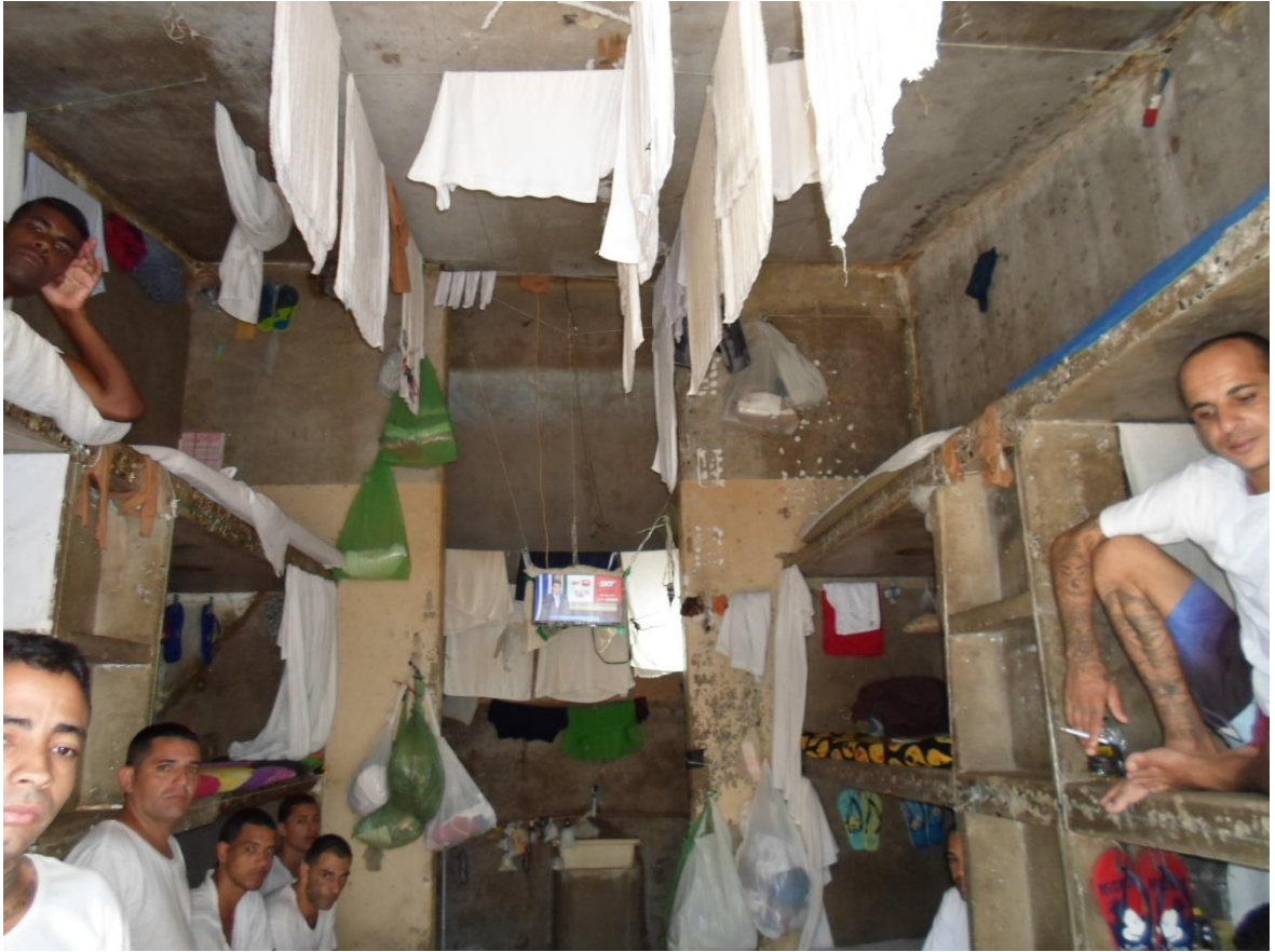
Figura 4. Cela do raio 7