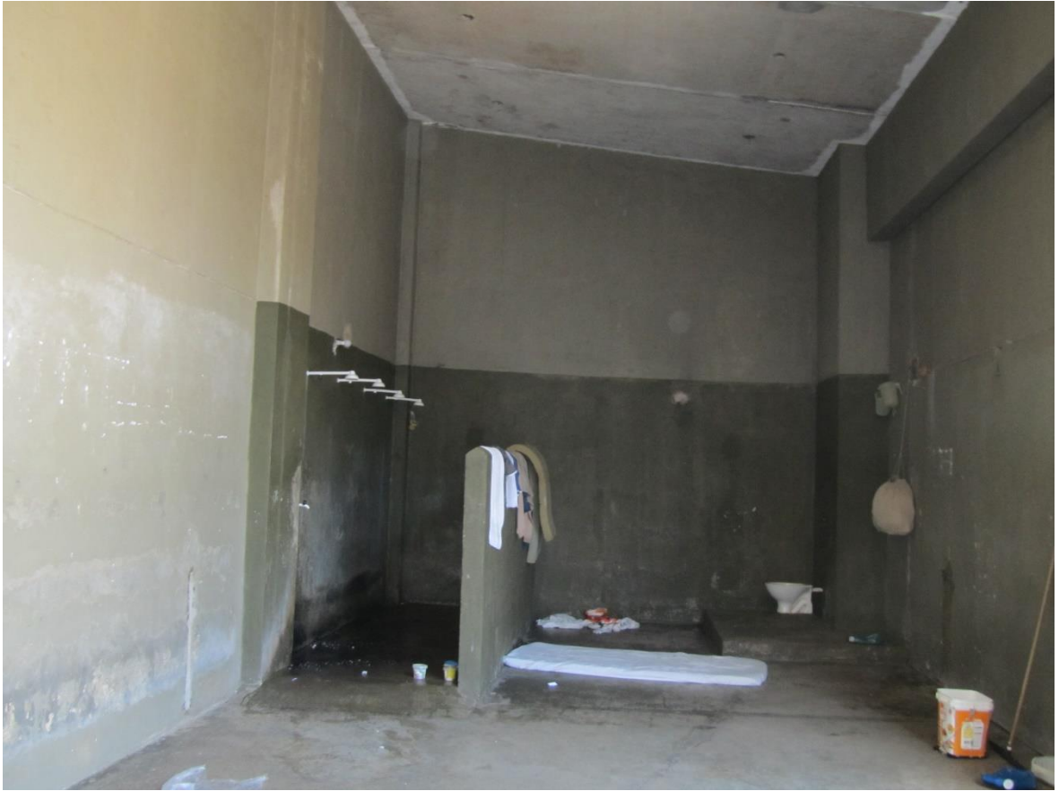
Figura 19. Chuveiros que fornecem água quente aos presos