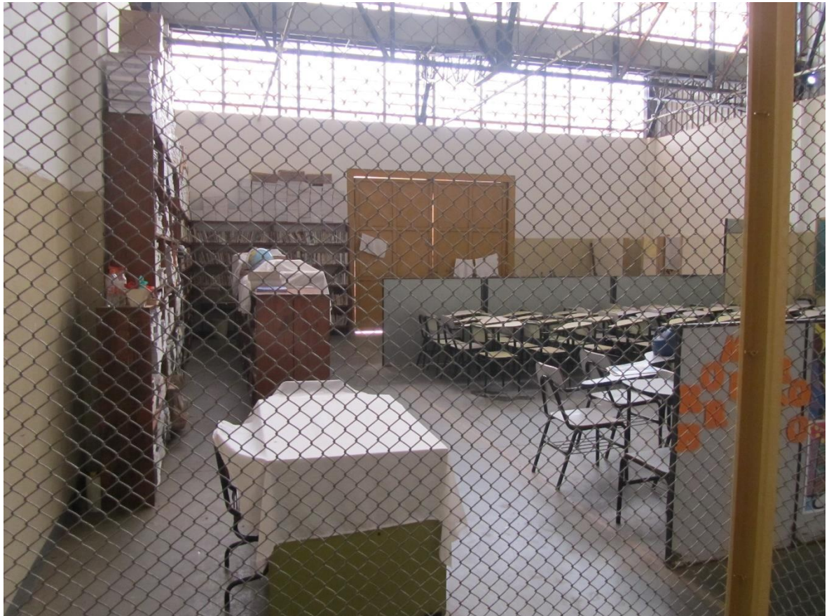
Figura 38. Sala de aula da unidade

As informações sobre educação e trabalho fornecido disponibilizados pela unidade aos presos foram objeto de questionamento através de ofícios encaminhados, porém, sem respostas pela unidade.