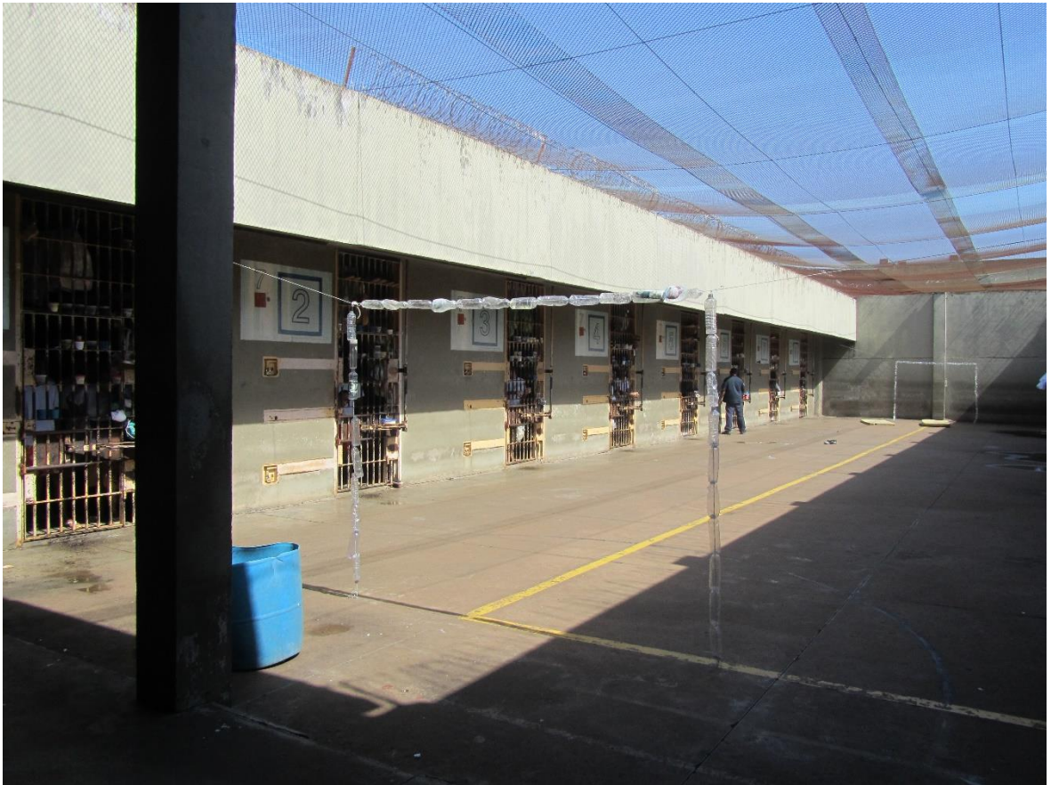
Figura 10. Pátio do raio 7