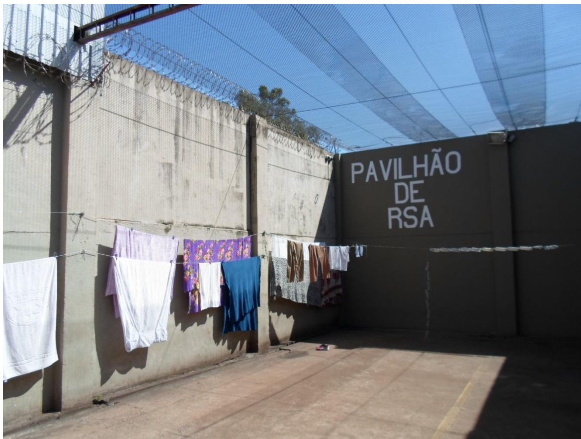
Figura 16. Pátio do "pavilhão do RSA"