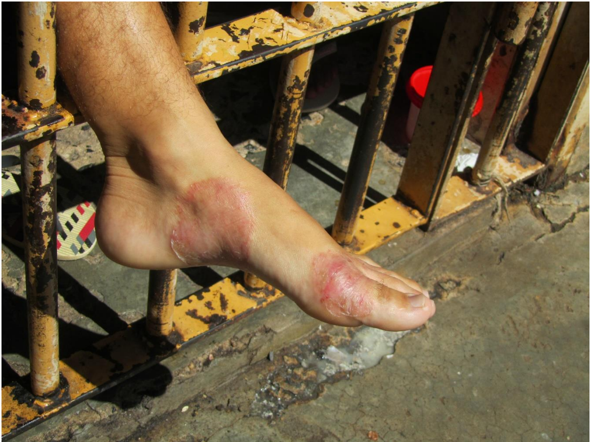
Figura 29. Doenças de pele estão entre as reclamações dos presos