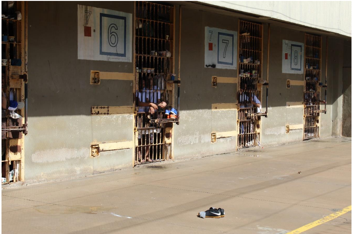
Figura 9. Celas do raio 7