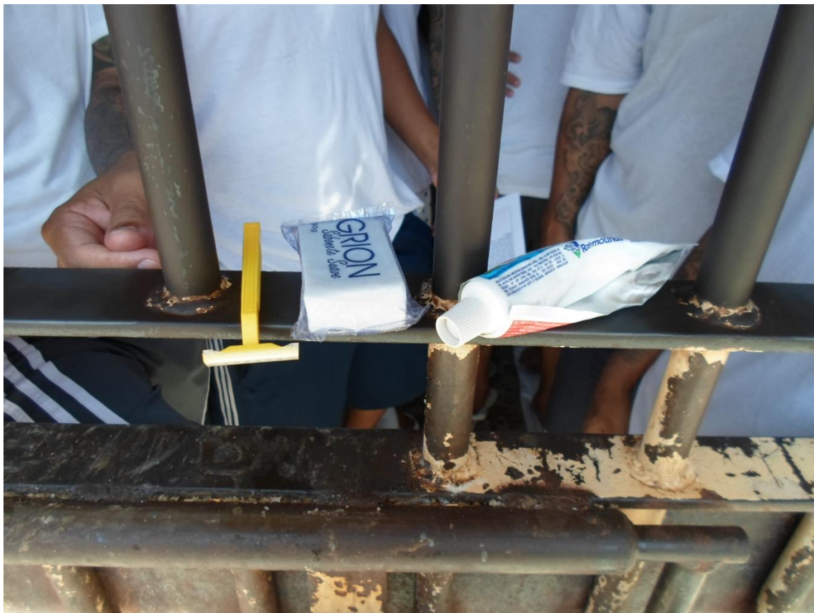
Figura 34. Itens entregues pela unidade

Assim, é necessária a complementação dos itens básicos pelos familiares através do SEDEX.