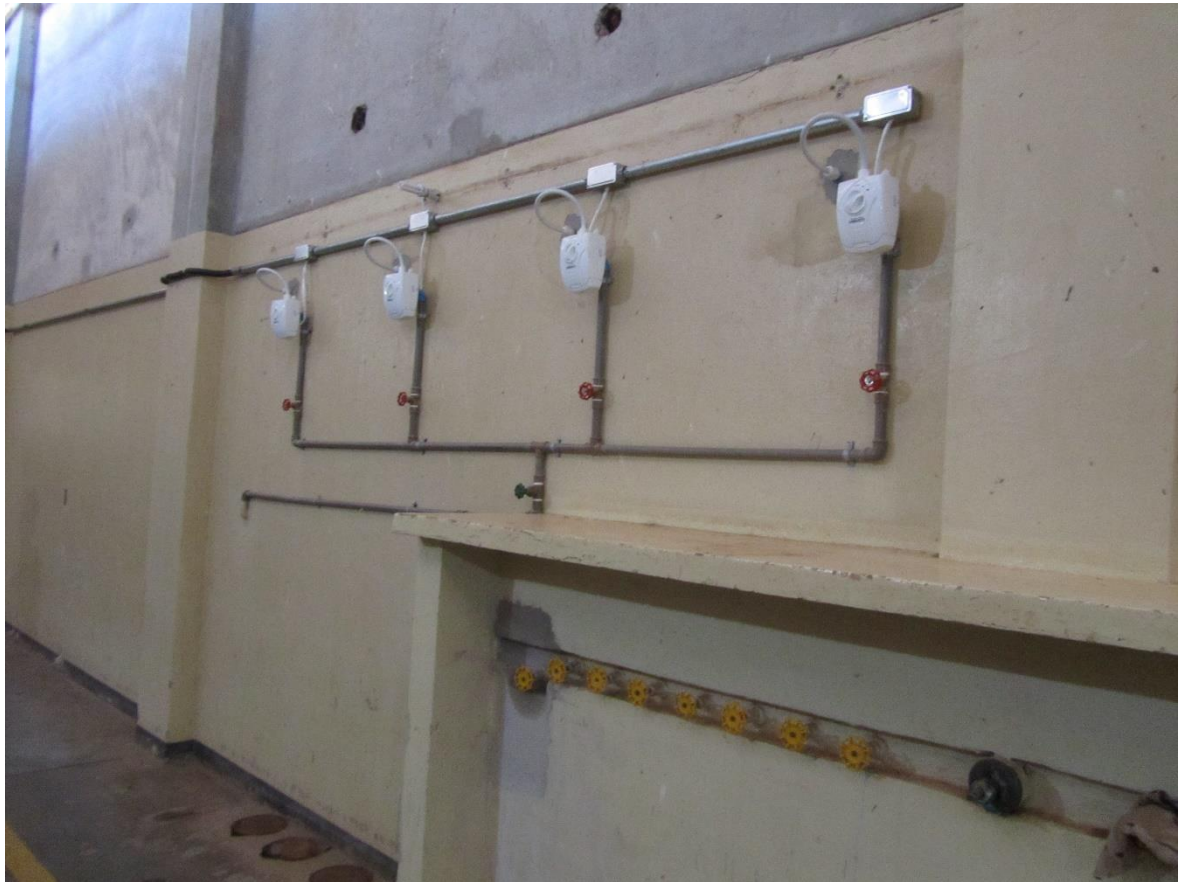
Figura 18. Aquecedor dos chuveiros quentes