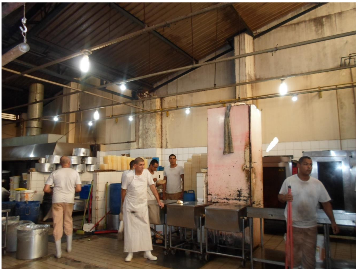
Figura 26. Cozinha da unidade