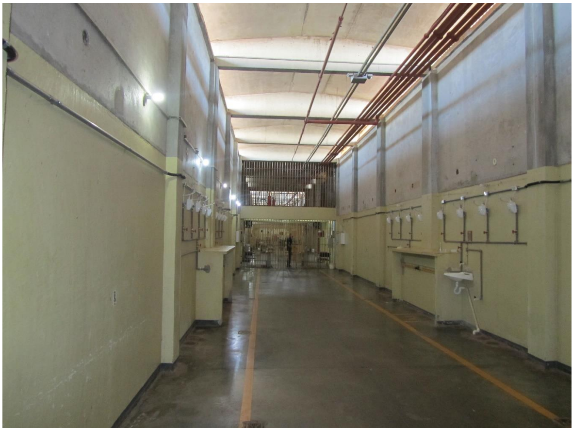
Figura 17. Aquecedor dos chuveiros com água quente dos pátios

Além disso, o acesso a este chuveiro só é possível nos horários do banho de sol, haja vista que os chuveiros instalados dentro das celas só fornecem água fria. Isso foi uma reclamação das pessoas presas, tendo em vista que acabam não conseguindo usar tais chuveiros com frequência.