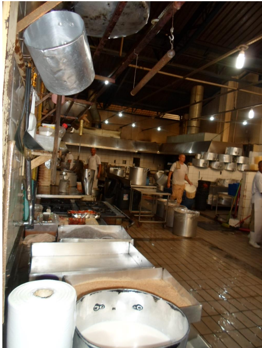
Figura 25. Cozinha da unidade.