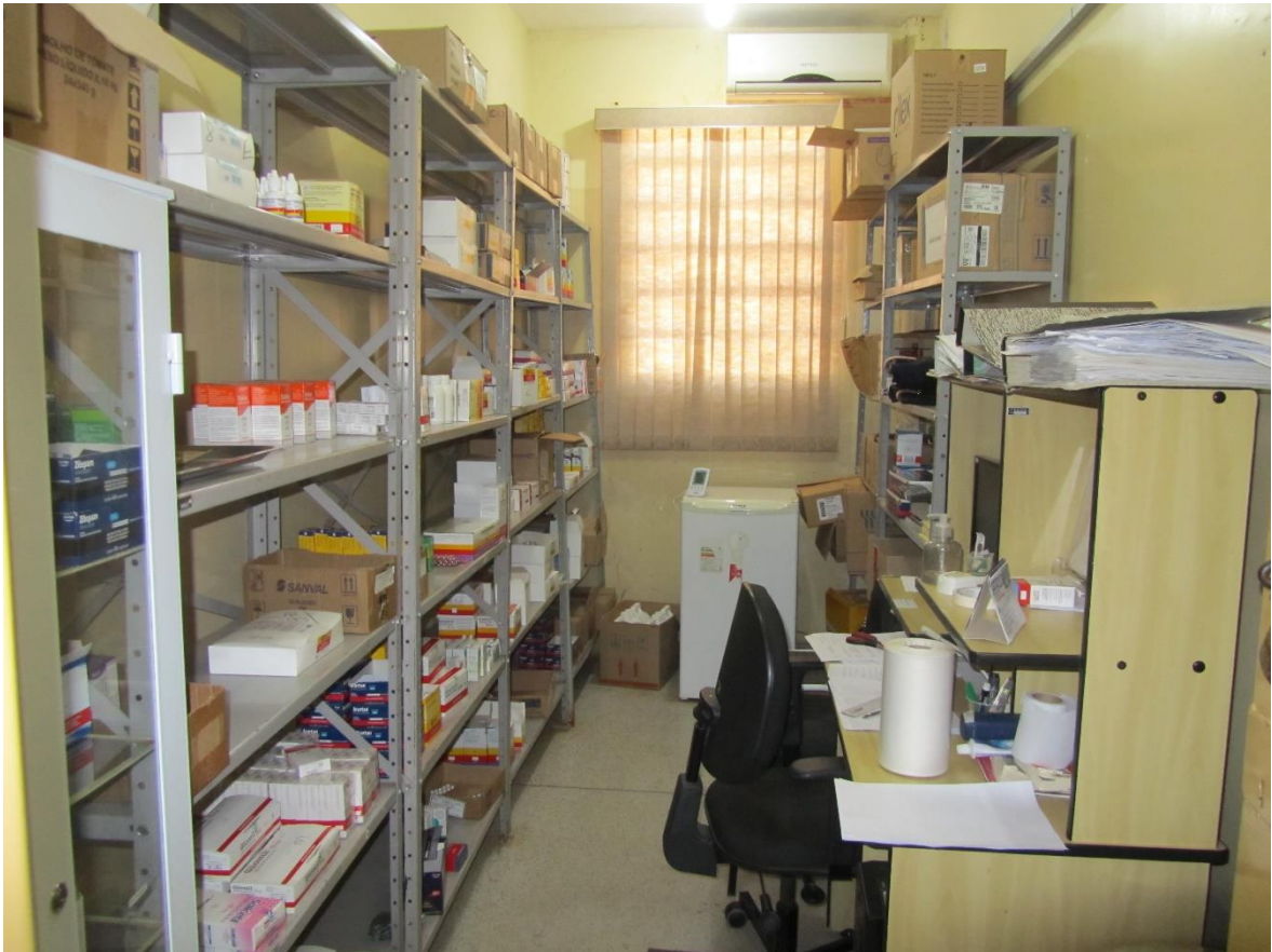
Figura 31. Dispensário de medicamentos