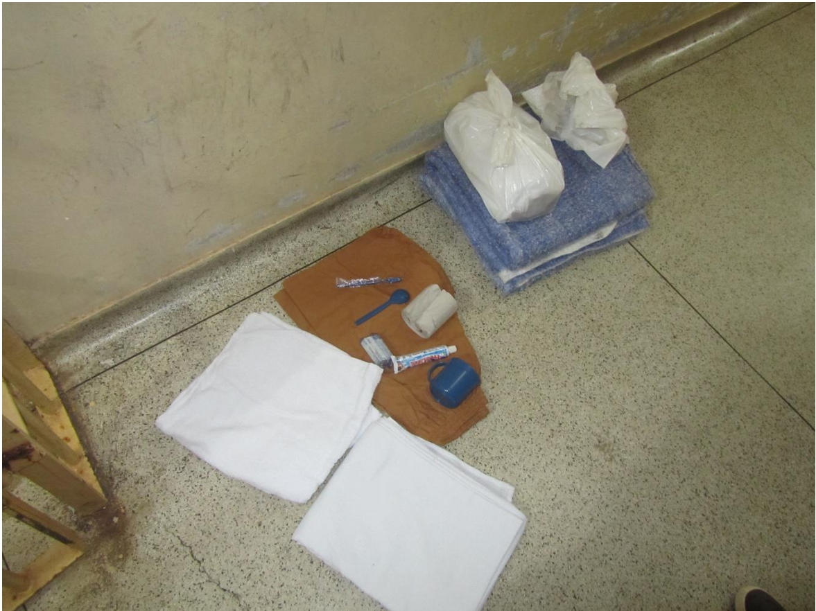
Figura 36. Kits pessoais entregues aos presos

Além disso, reclamaram da demora de entrega dos produtos enviados por SEDEX, após a chegada na unidade. Houve muitas reclamações de que o SEDEX não era aberto na presença dos sentenciados e que eram obrigados a assinar o recibo antes da entrega e conferência dos itens que lhes havia sido enviado pelos familiares.