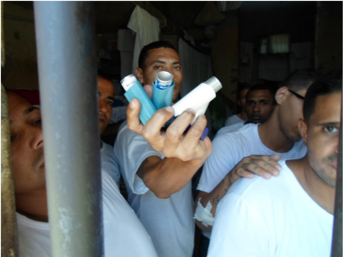
Figura 28. Bombinha" utilizada em casos de bronquite/asma