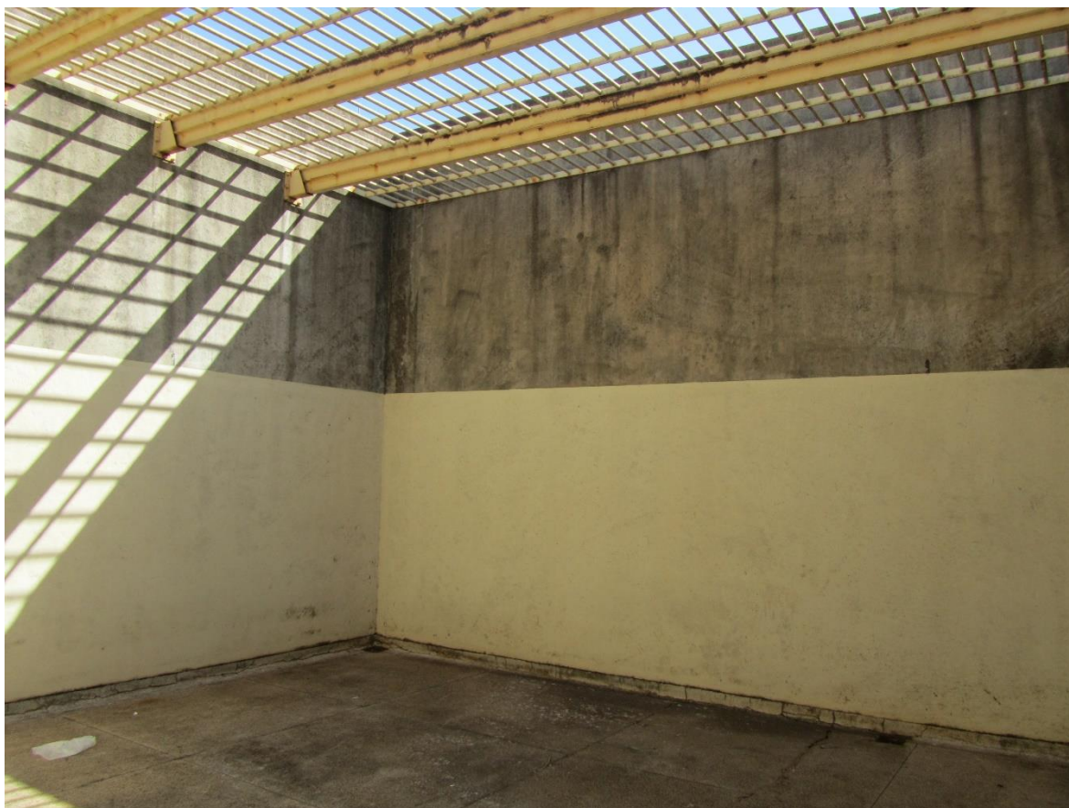
Figura 1. Pátio de banho sol da enfermaria