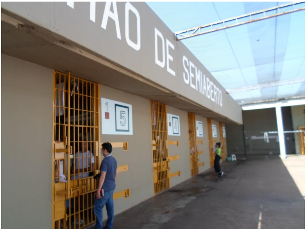
Figura 15. Pátio do "pavilhão do RSA"