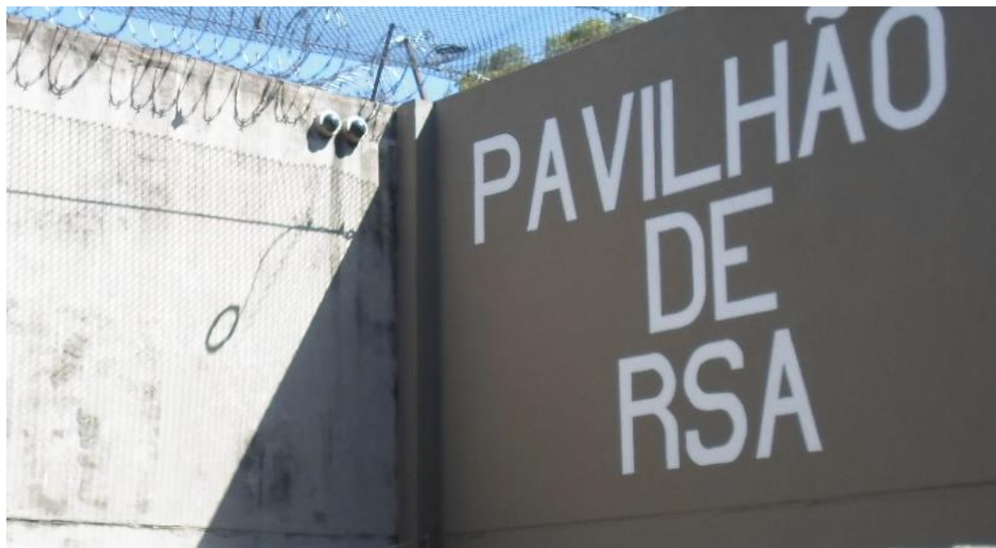
Figura 37. Câmeras instaladas no "pavilhão do semiaberto"

Importante ressaltar que há câmeras de vigilância no pátio dos raios.