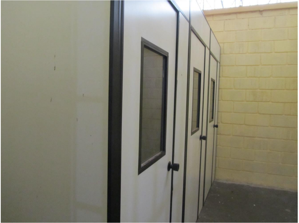
Figura 32. Salas para videoconferência