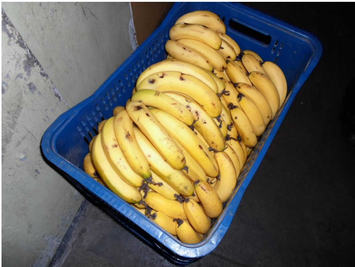
Figura 21. Fruta que seria entregue aos presos no momento da inspeção

Os presos relataram que, apesar da pouca quantidade de comida servidas nas refeições, em razão do longo período entre o jantar e o café da manhã, passaram a juntar restos da alimentação de forma coletiva para que pudessem se alimentar durante o intervalo entre as refeições.