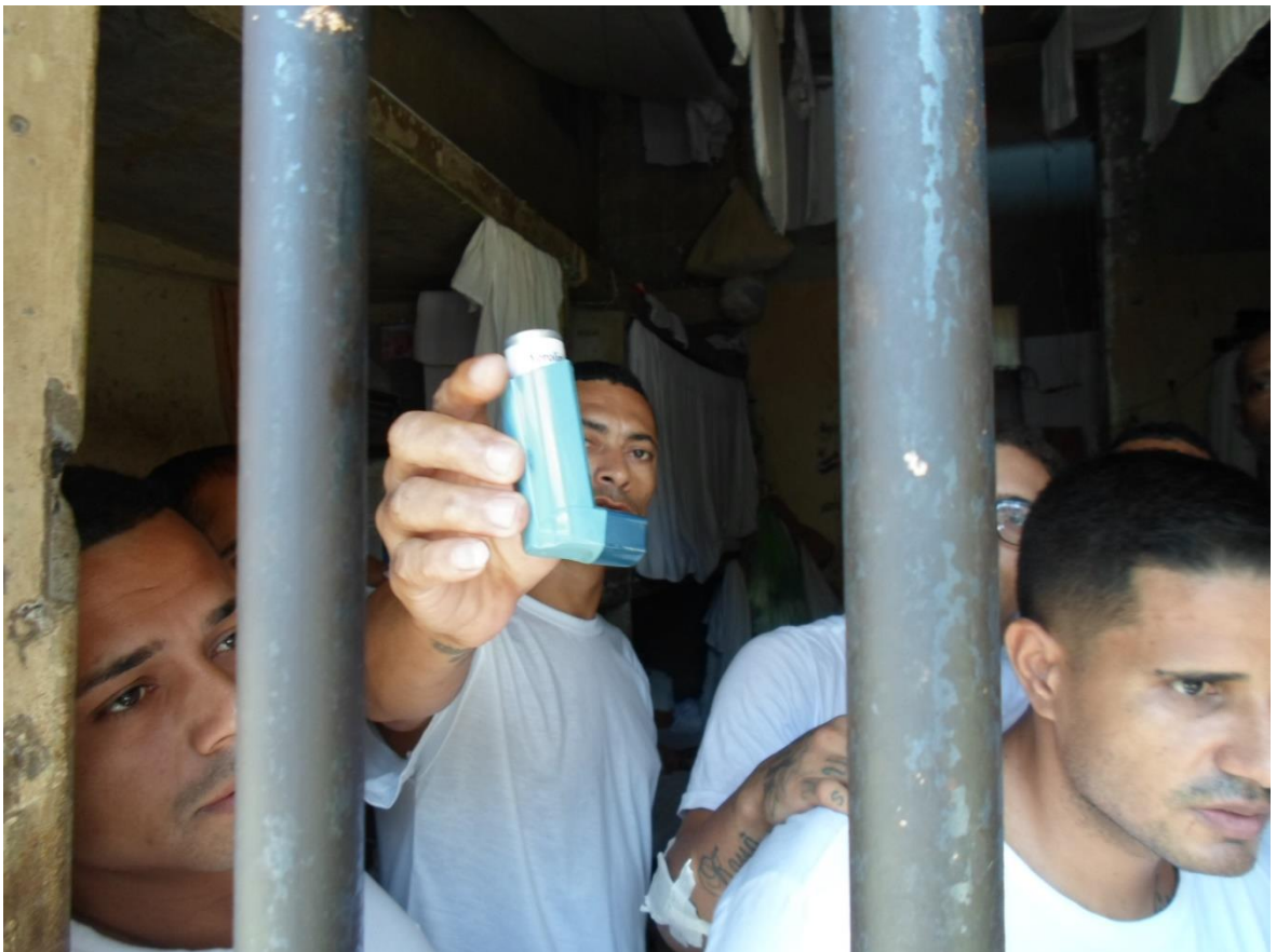
Figura 27. "Bombinha" utilizada em casos de bronquite/asma

Houve muitos relatos de presos que necessitam de bombinha para asma/bronquite e tais equipamentos acompanhados do medicamento necessário não eram entregues com regularidade.