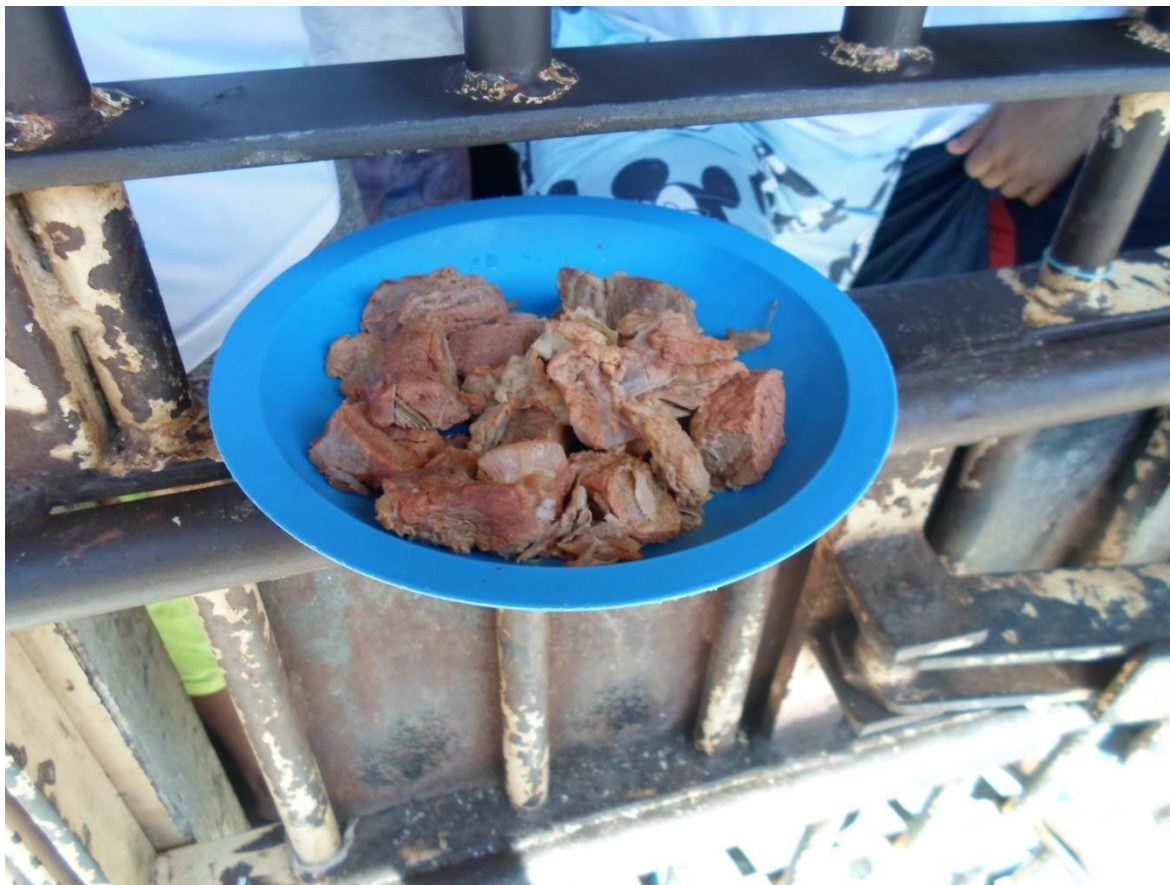
Figura 24. Restos de comida que são reservados para alimentação durante o intervalo entre o jantar e o café da manhã do dia seguinte

Os presos relatam que tem que complementar a alimentação através do que é enviado pelos familiares ou adquirido através de pecúlio, porém, relataram que as restrições na entrada de alimentos pela Secretaria, em razão da pandemia, têm colocado dificuldades para que eles possam suprir esta falta de alimentação adequada.