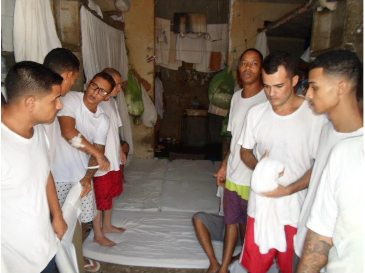
Figura 5. Cella do raio 7