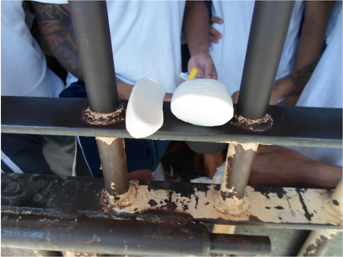
Figura 35. Sabonete enviado pelos familiares e que são cortados ao passar pela revista na unidade

Os presos são obrigados a manter os cabelos e barbas bem aparados, apesar da falta da entrega de kits necessários para este fim. Há relatos de presos punidos administrativamente com falta disciplinar por não manter o padrão de corte imposta pela unidade.