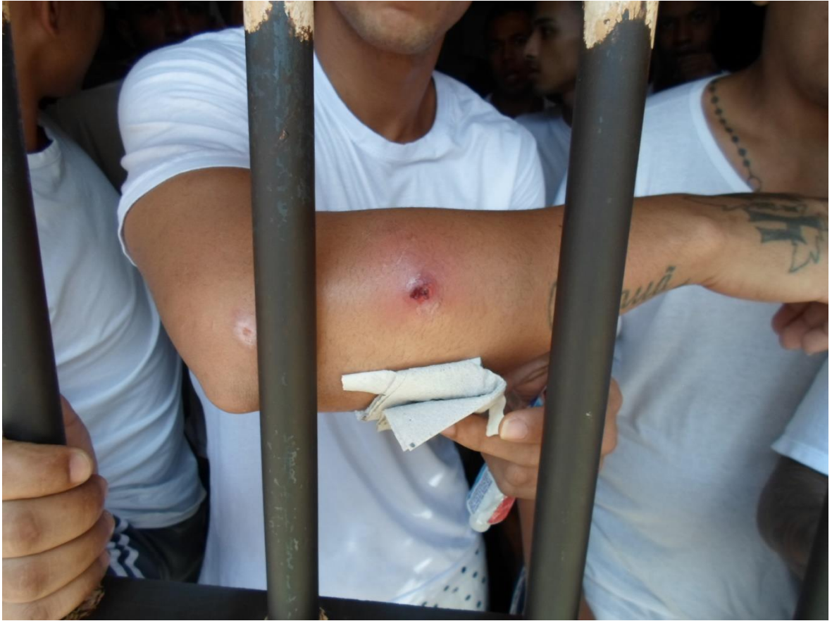
Figura 30. Doenças de pele