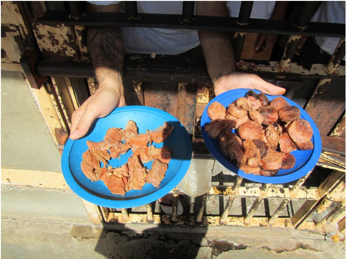
Figura 22. Restos de comida que são reservados para alimentação durante o intervalo entre o jantar e o café da manhã do dia seguinte