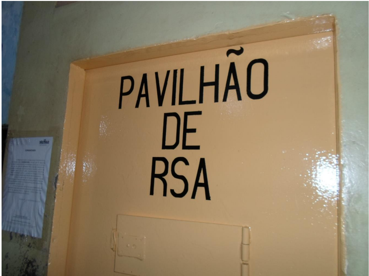
Figura 13. Acesso ao "pavilhão do RSA"