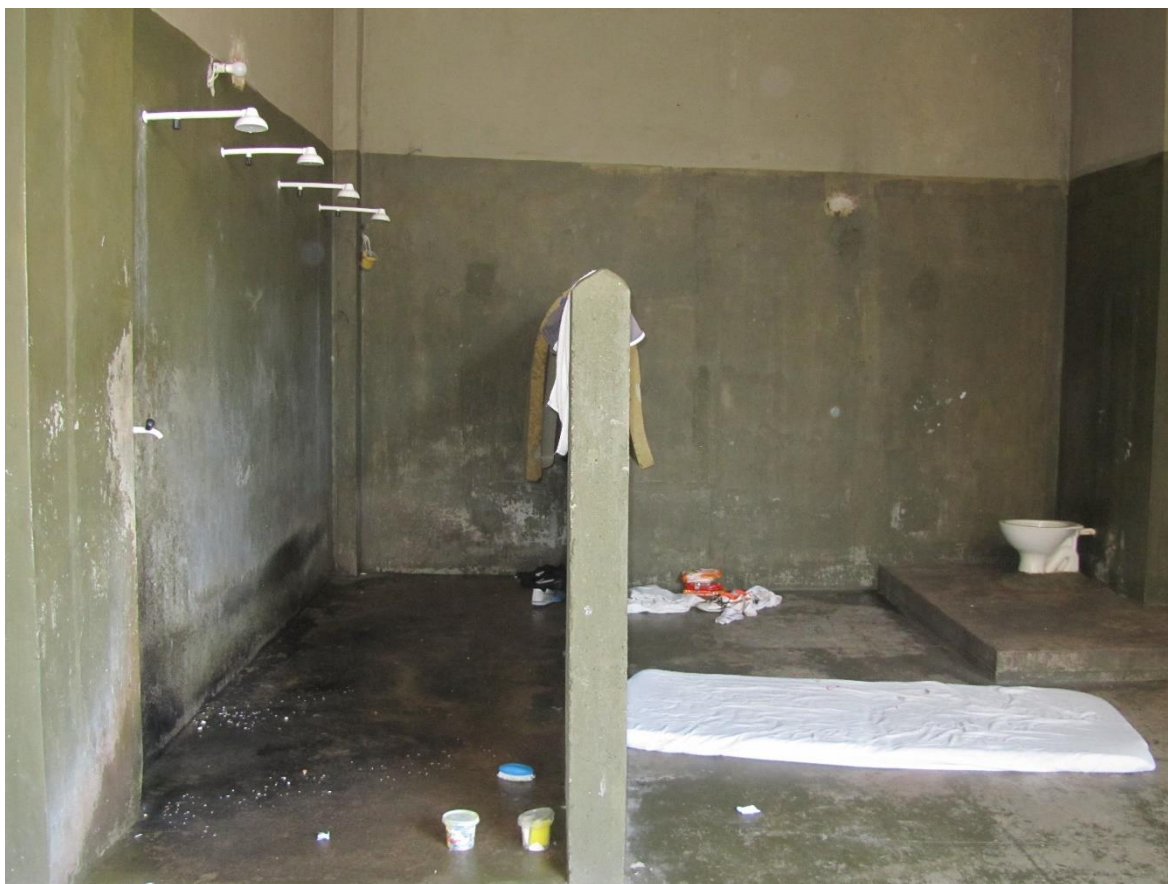
Figura 20. Chuveiro de água quente