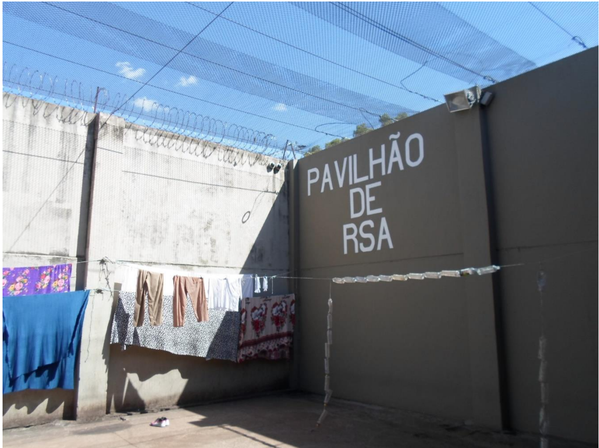
Figura 14. Pátio do "pavilhão do RSA"