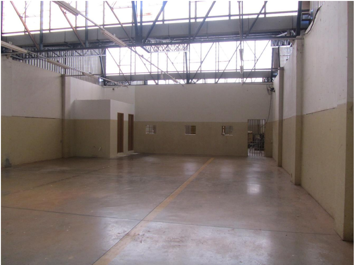
Figura 39. Pavilhão para instalação de oficina