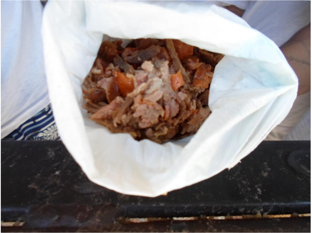
Figura 23. Restos de comida que são reservados para alimentação durante o intervalo entre o jantar e o café da manhã do dia seguinte