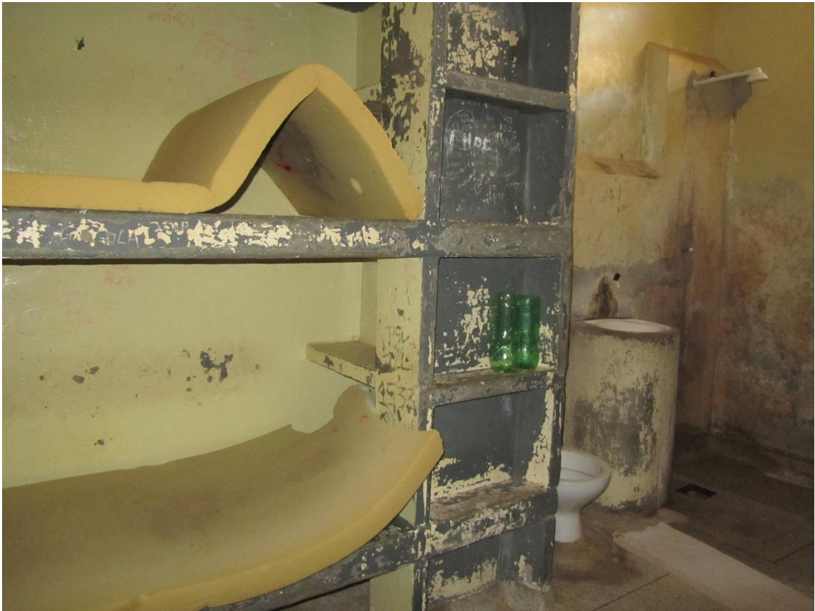
Figura 2. Cella desabitada do setor disciplinar