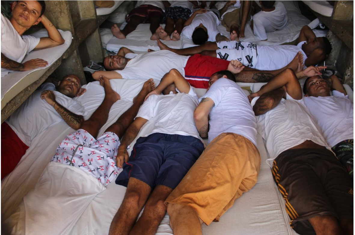
Figura 7. Superlotação obriga os presos a dormirem no mesmo colchão.