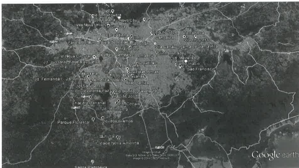
Mapa de Comunidades Tuteladas em junho/2015

E em junho de 2015, atende a 68 comunidades , cerca de 33.086 famílias.