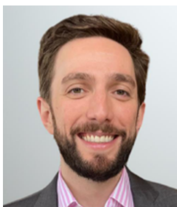
RAFAEL PITANGA GUEDES