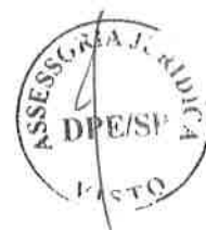
MÁRCIO FERNANDO ELIAS ROSA SECRETARIA DA JUSTIÇA E DEFESA DA CIDADANIA